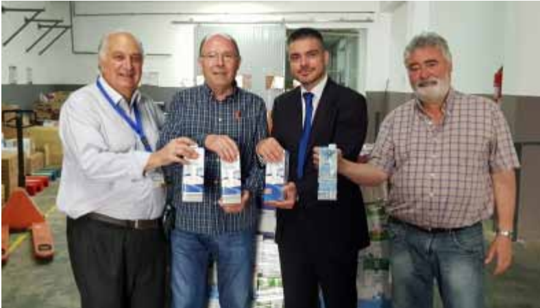
Fundació La Caixa con miembros del patronato del Banc

Esta iniciativa promovida por la Obra Social de “La Caixa” a favor de los Bancos de Alimentos, es disponer las 182 oficinas de La Caixa como un brazo de la obra Social durante unos días. Concretamente del 12 al 23 de Junio.